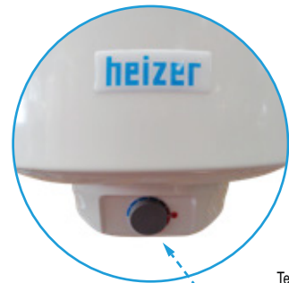
Termostato di controllo esterno External control thermostat